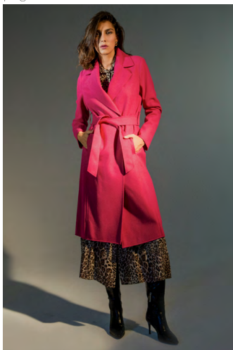
Abito AB115A1TB; Cappotto CP0005A1TB