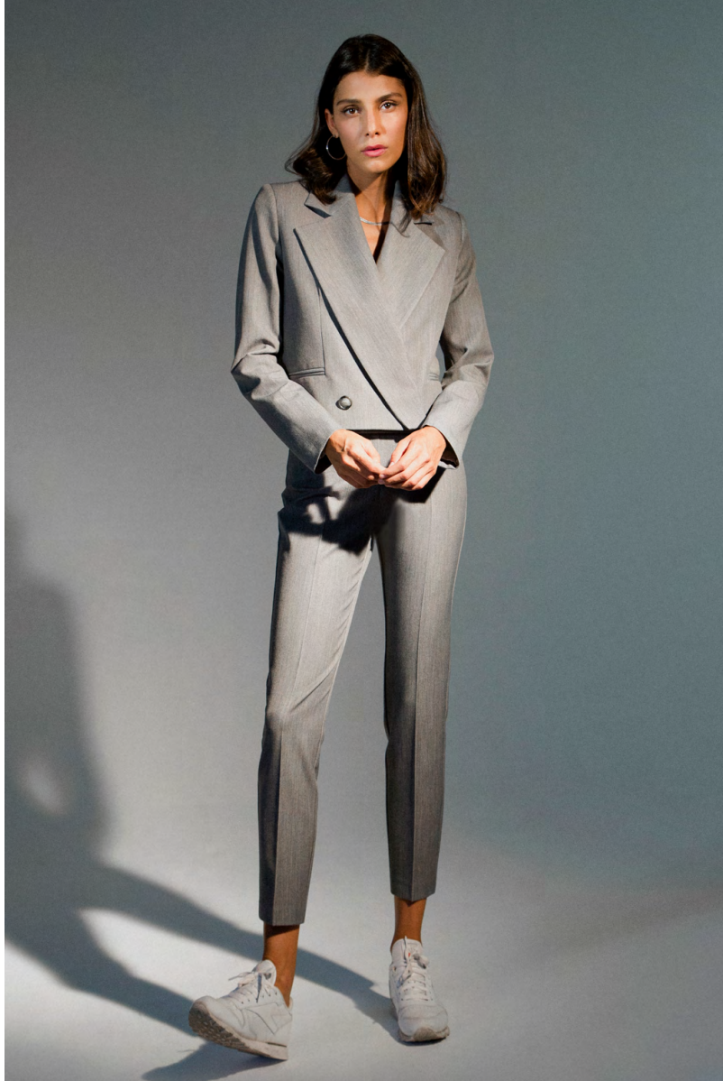
Giacca cropped GI303AOTB ; Pantalone sigaretta PA306AOTB