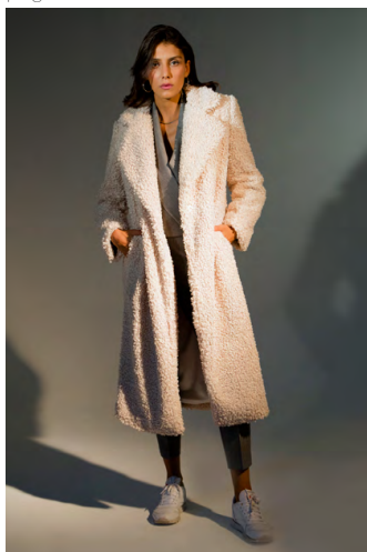
Pantalone sigaretta PA306AOTB; Giacca Cropped GI303AOTB; Teddy CP300AOTB