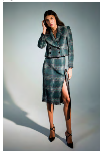
Gonna chanel GN303AOTB; Giacca GI305AOTB