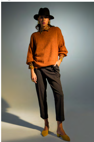
Pantalone straccali PA303AOTB ; Camicia CA106AOTB ; MaxiPull MA8748ITTB