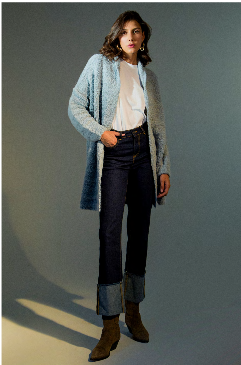
T-shirt TS333RGTB ; Cardigan MA9540ITTB ; Jeans PA001IFTB