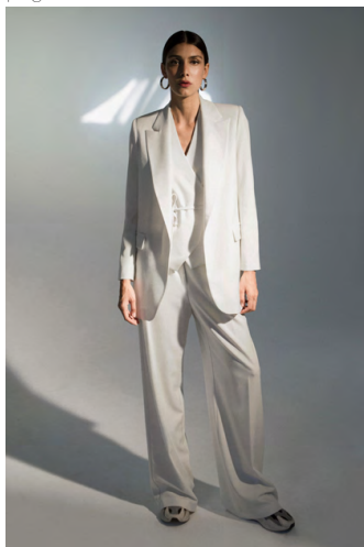
Blazer lungo GI302AOTB; Gilet GT300AOTB; Pantapalazzo PA302AOTB