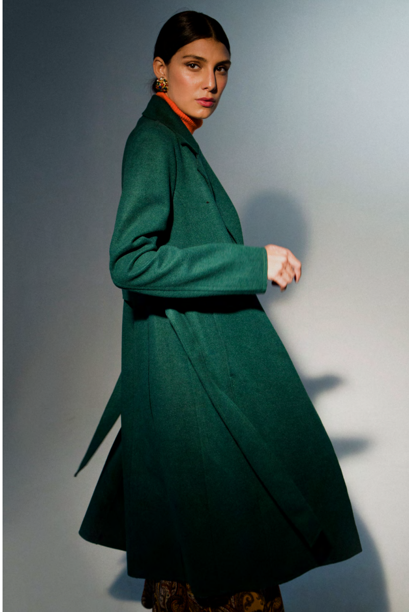
Cappotto CP0005A1TB; Dolcevità MA9466ITTB; Gonna cachemire GN111AOTB