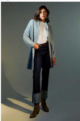
Jeans Pa001IFTB; T-shirt TS333RGTB; Cardigan MA9540ITTB