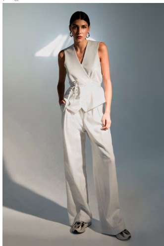
Gilet GT300AOTB; Pantapalazzo PA302AOTB