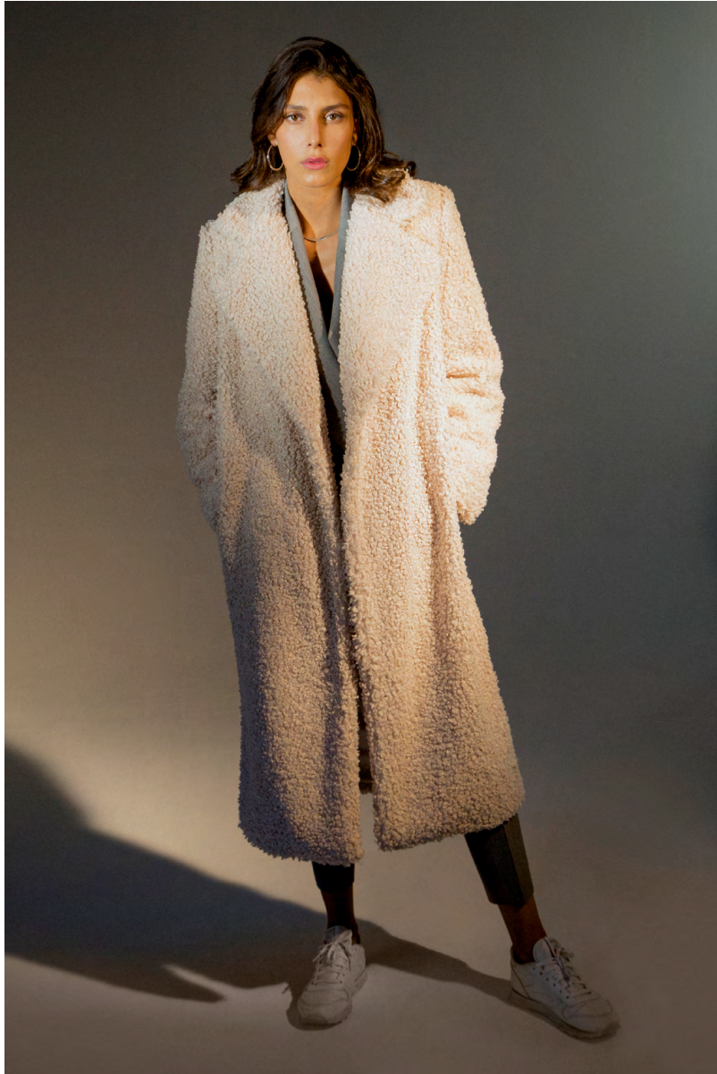
Teddy CP300A0TB; Giacca cropped GI303A0TB; Pantalone sigaretta PA306A0TB