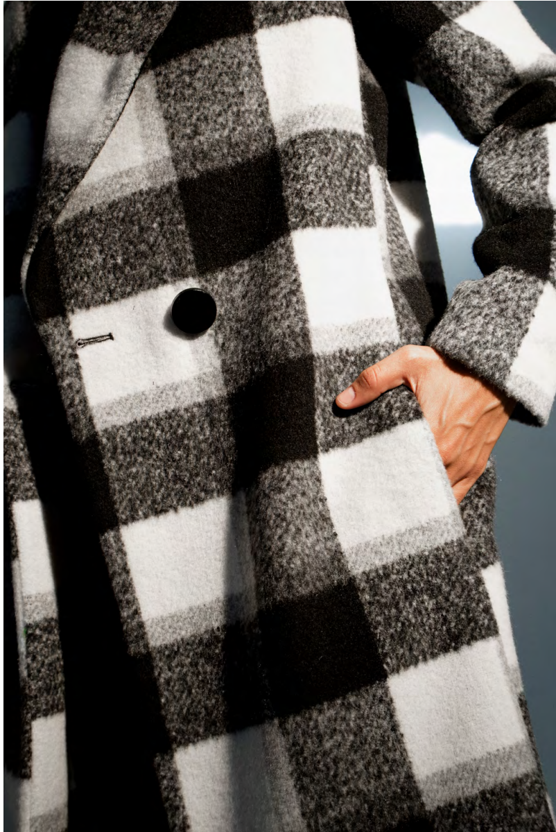
Cappotto quadro doppiopetto CP301A1TB