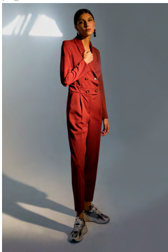
Tuta doppio petto TU300AOTB