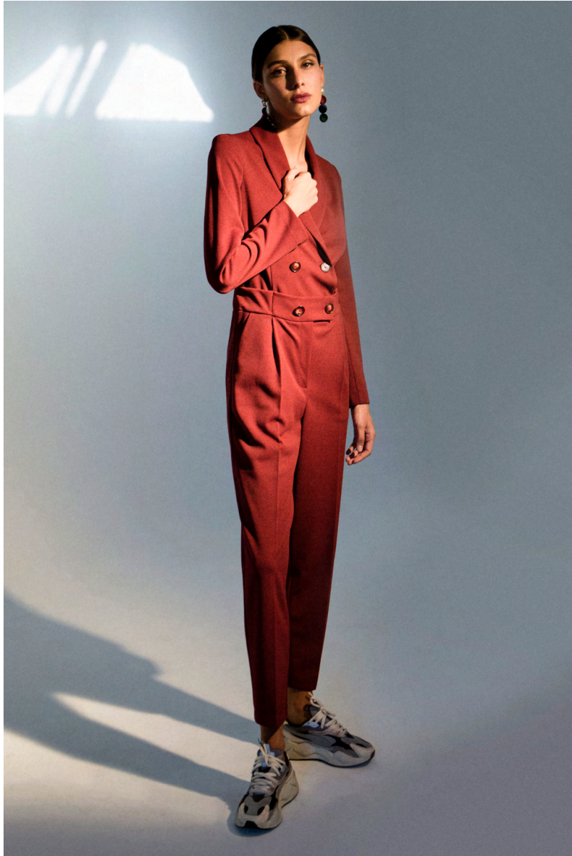
Tuta doppiopetto TU300A0TB