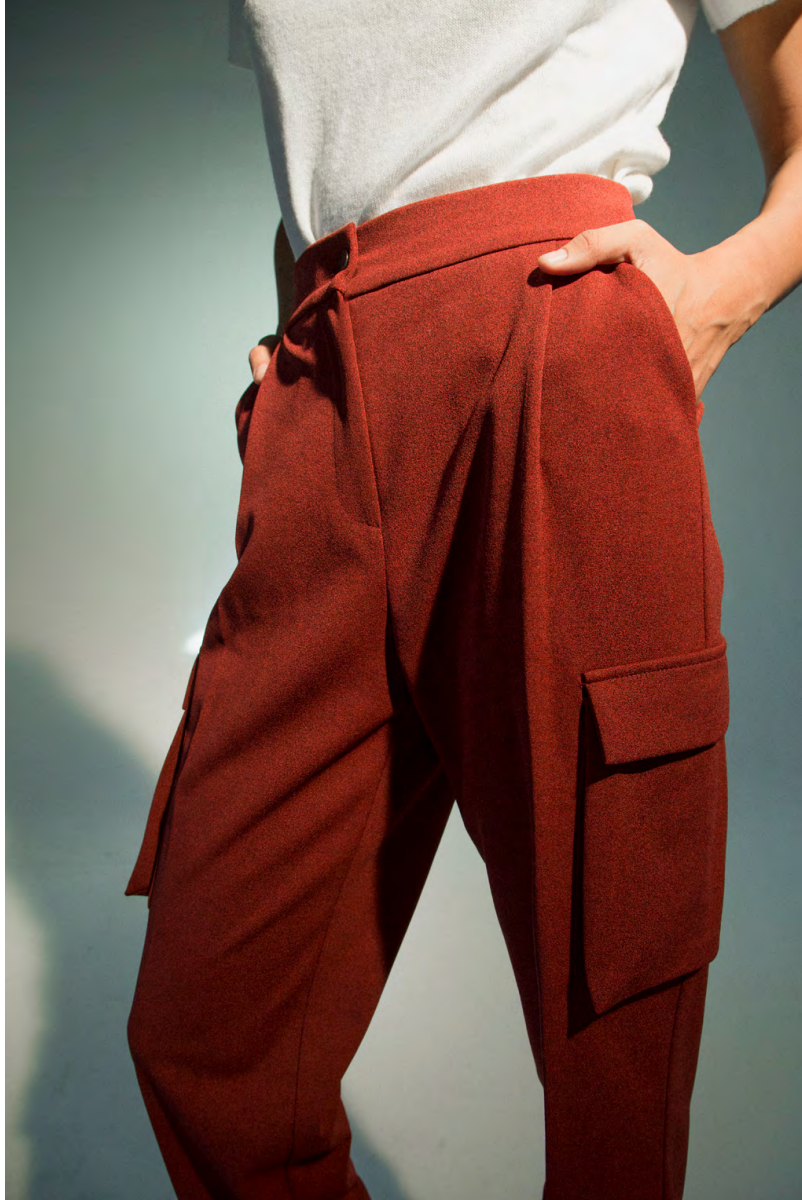
Dolcevita MA9466ITT ; Pantalone Combat PA307AOTB