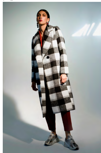
Cappotto quadro doppiopetto CP301A1TB