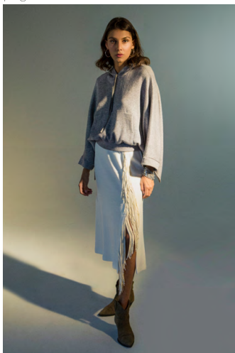
Gonna GN300AOTB; Maxi felpa MA300AOTB