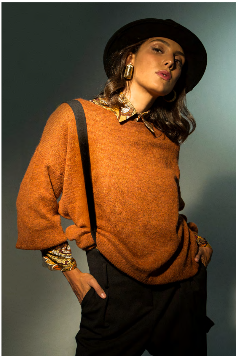
Camicia CA106AOTB; MaxiPull MA8748ITTB; Pantalone straccali PA303AOTB