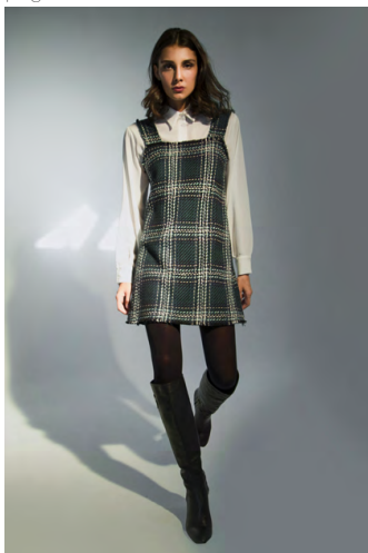
Scamiciata AB300AOTB; Camicia georgette CA151A1TB