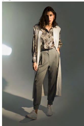
Gilet MA0313630PRTB; Camicia piuma CA106A1TB; Pantalone PA307AOTB