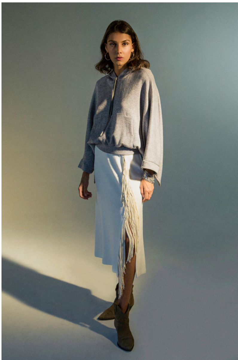
Maxi felpa MA300A0TB ; Gonna GN300A0TB