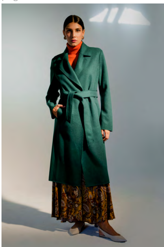
Cappotto CP0005A1TB; Dolcevita MA9466ITTB; Gonna cachemire GN111AOTB