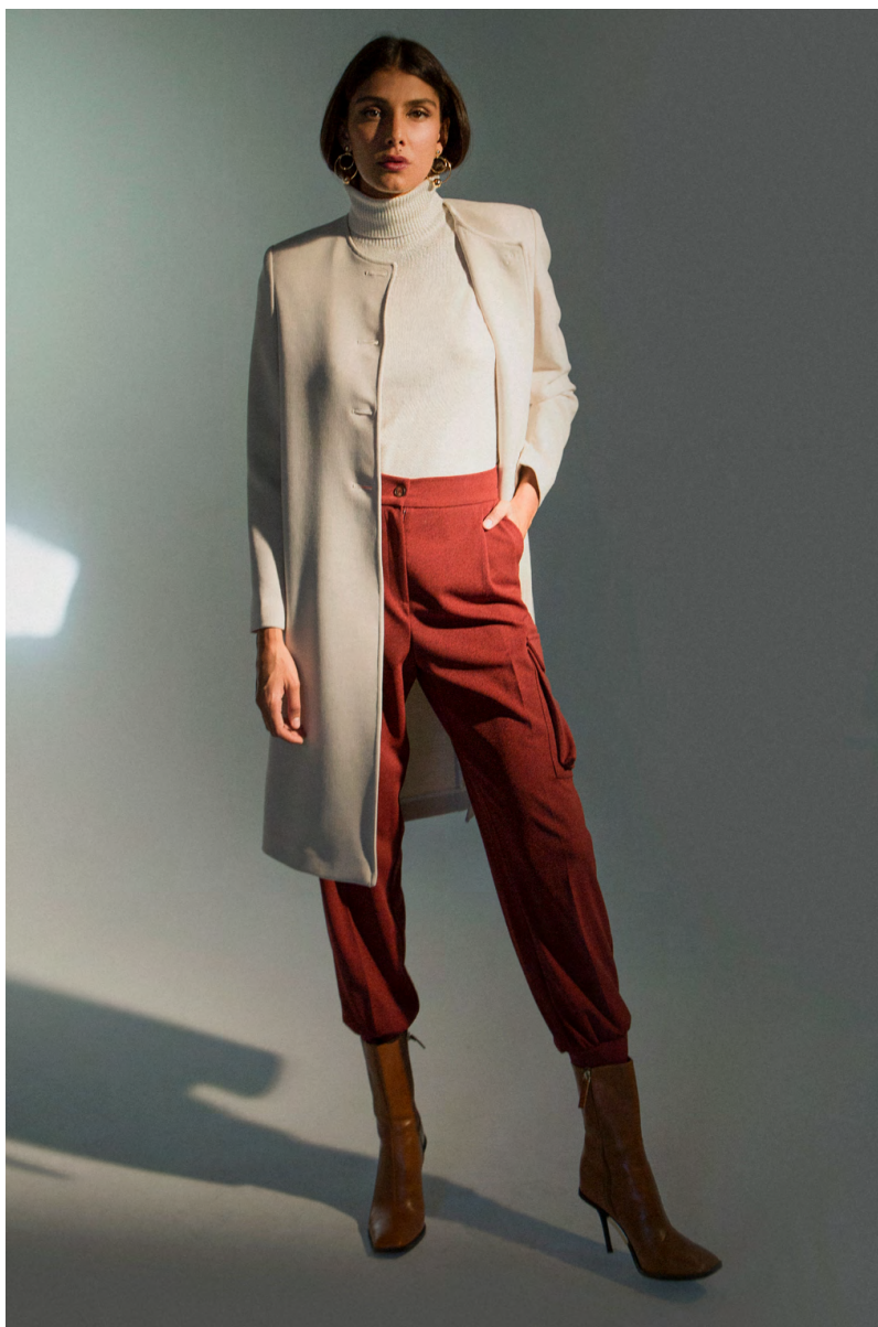
Spolverino CP302AOTB ; Dolcevita MA9466ITTB ; Pantalone Combat PA307AOTB