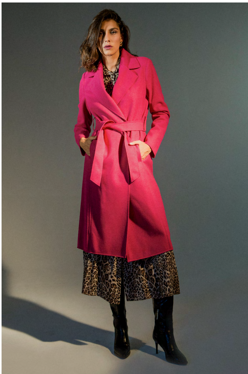
Cappotto CP0005A1TB; Abito AB115A1TB