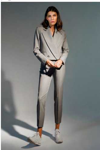
Pantalone sigaretta PA306AOTB; Giacca Cropped GI303AOTB