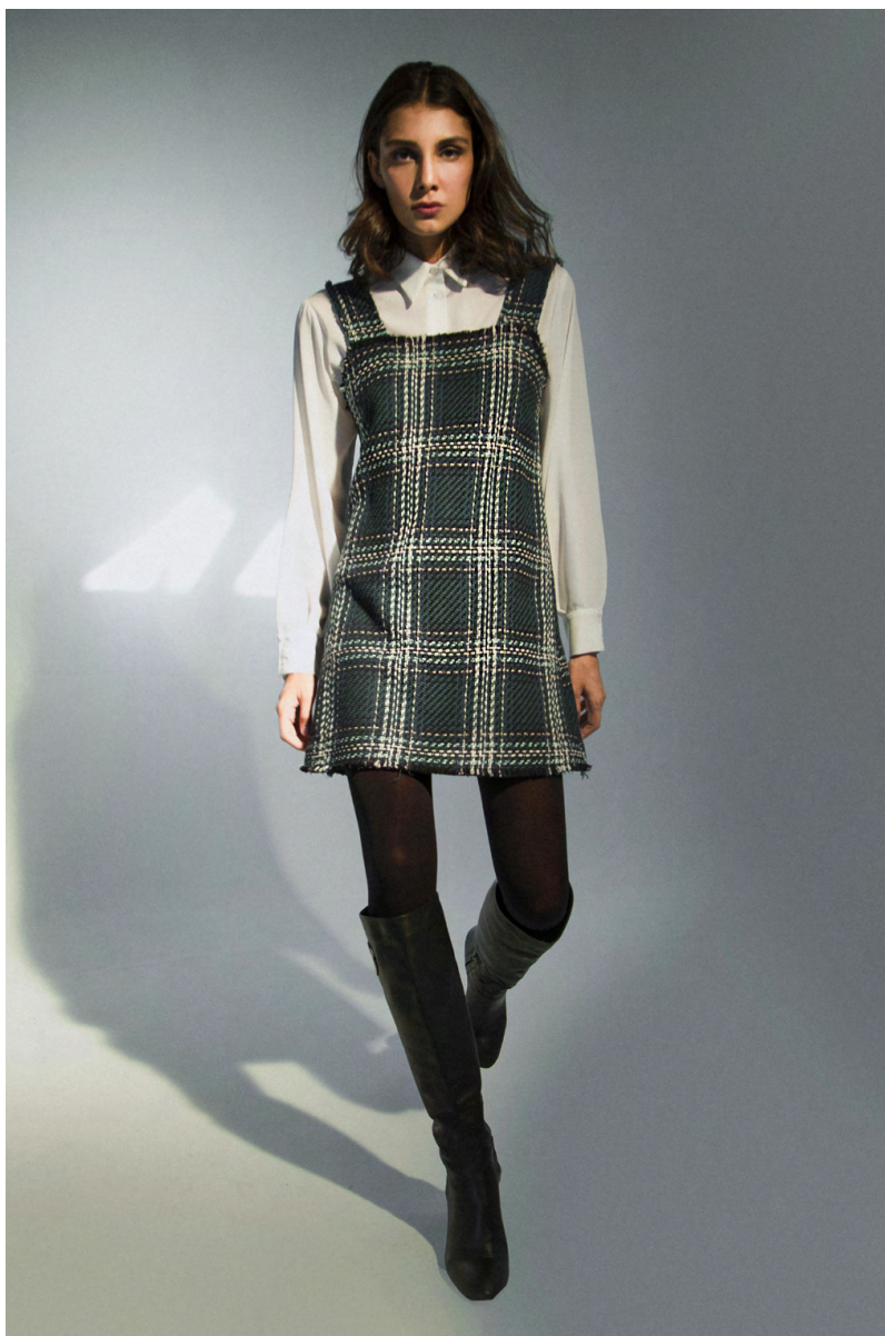
Scamciata AB300A0TB ; Camicia georgette CA151A1TB