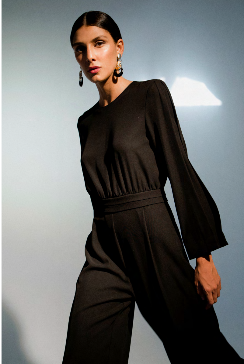
Tuta fluida TU301AOTB