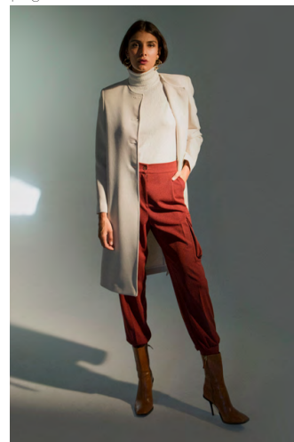
Spolverino CP302AOTB ; Dolcevita MA9466ITTB ; Pantalone Combat PA307AOTB