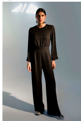
Tuta fluida TU301AOTB