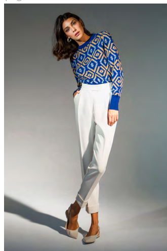
Maglia MA0315701PRTB; Pantalone doppio crêpe PA309AOTB