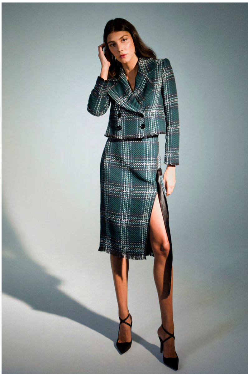
Giacca GI305AOTB ; Gonna Chanel GN303AOTB