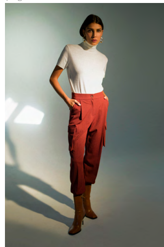
Dolcevita MA9466ITTB ; Pantalone Combat PA307AOTB