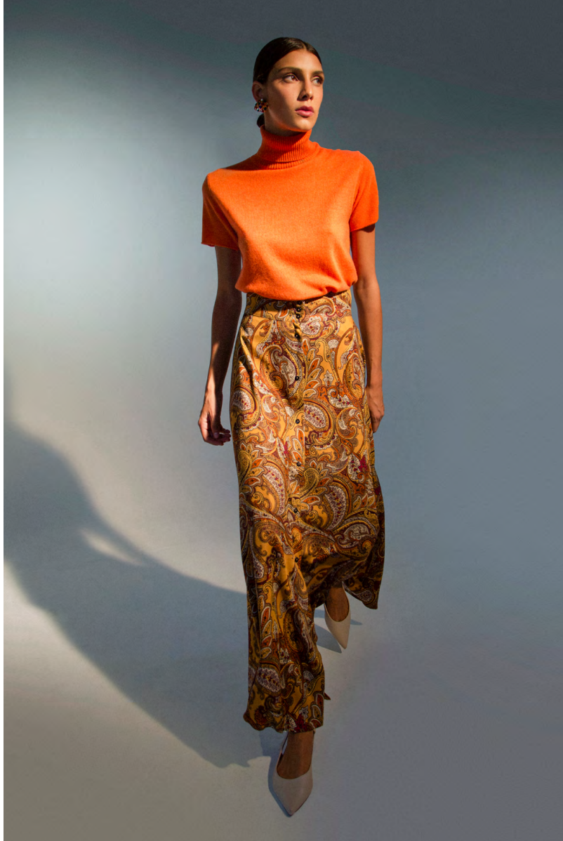
Dolcevita MA9466ITTB; Gonna cachemire GN111AOTB