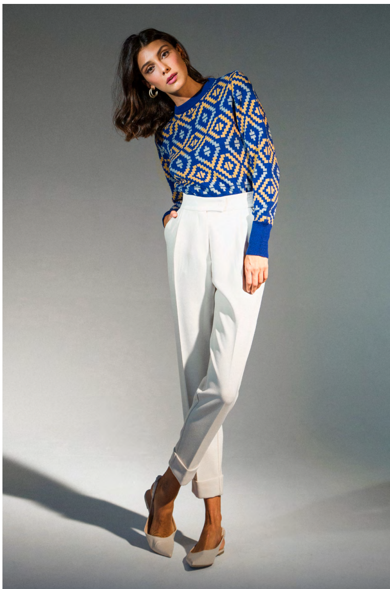
Maglia MA0315701PRTB ; Pantalone doppio crêpe PA309AOTB